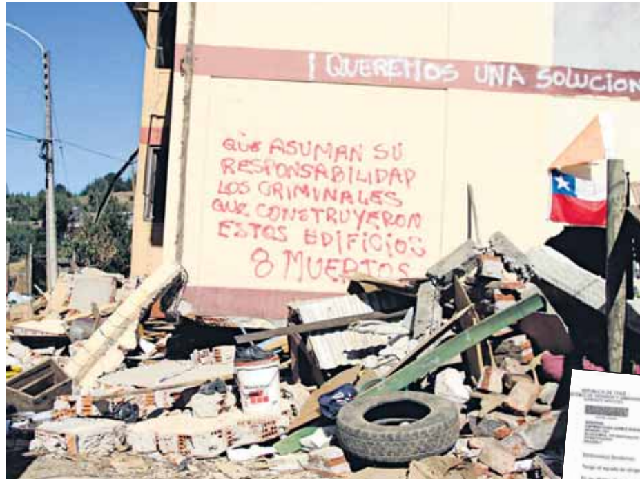
El primer piso de este block simplemente desapareció.

El colapsado edificio en Constitución cuyo primer piso literalmente desapareció para el día del terremoto del 27 de febrero pasado, y que les costó la vida a 8 personas, tenía fallas de construcción que fueron ad-