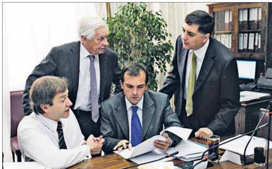
La Comisión de Hacienda continuó hoy el debate del proyecto.

que “no siga perdiendo el tiempo con las indicaciones que quiere la UDI porque no tienen los votos nuestros ni de la Concertación”.