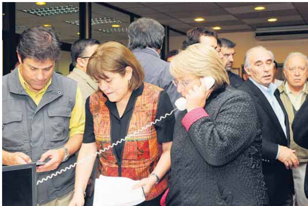
La ex Presidenta y la ex directora de la Onemi, en la madrugada del 27/3.