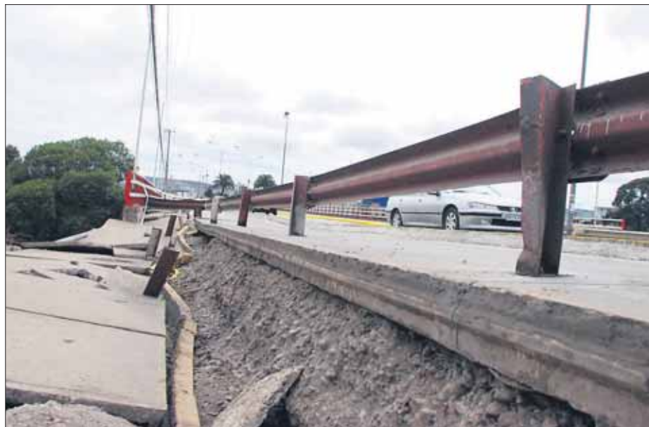
Mucha gente tomó sus autos por las vías dañadas y salió hacia los cerros.

Escenas de terror se mezclaban con bromas por la incredulidad respecto de la alerta de riesgo de tsunami entregada cerca del mediodía por el SHOA tras el fuerte sis-