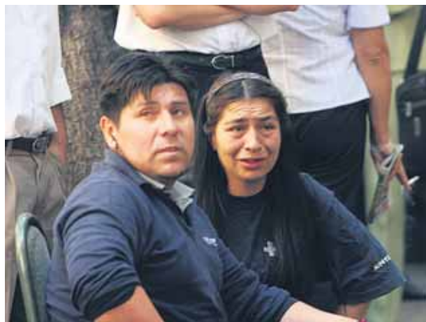
Caras de preocupación y temor abundaron esta mañana en Santiago Centro, tras la fuerte réplica.

Si bien la réplica se sintió con mucho ruido y remeció fuertemente las construcciones, no hubo corte de luz en la ciudad aunque los teléfonos tanto fijos como celulares no funcionaban.■